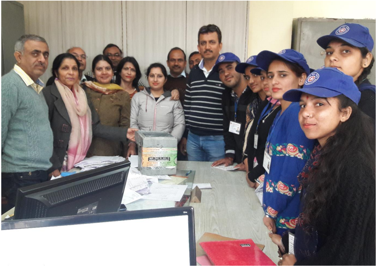
Photograph 36 Opening of donation bo