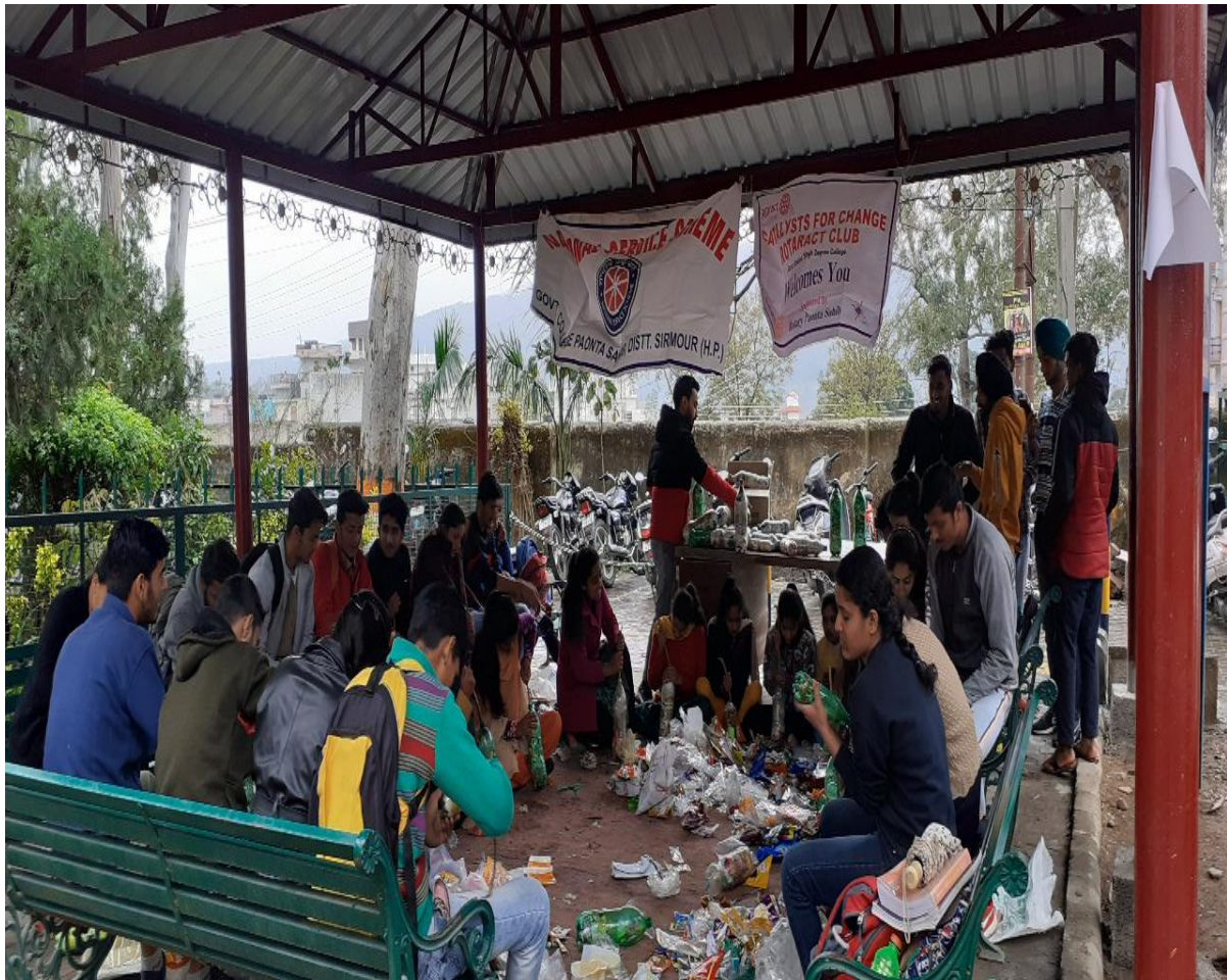
Photograph 33 NSS Unit cum rotaractors while making poly bricks