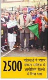
2500 महिलाओं ने नाहन पांवटा साहिब में आयोजित रैली में हिस्सा लिया