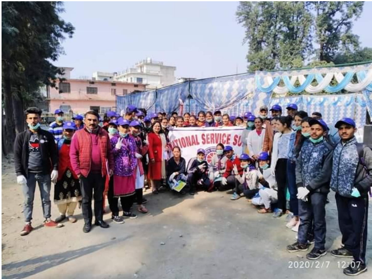
Photograph 28 Students of NSS, R&R attending the inaugural ceremony of cleanliness drive campaign at Municipal Ground