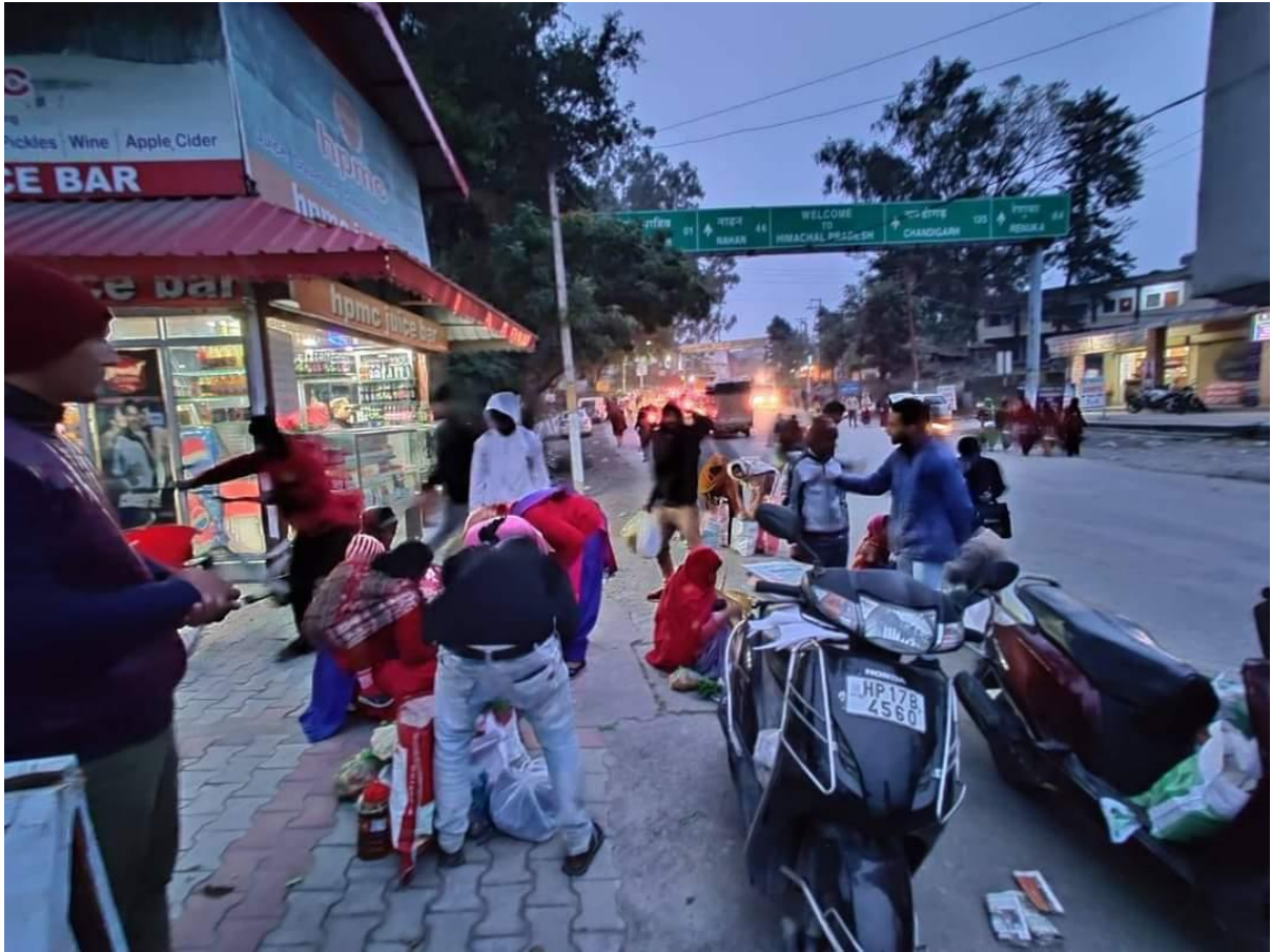
Photograph 32 Rotaractors at Kulhal barrage spreading awareness about minimum use of plastic