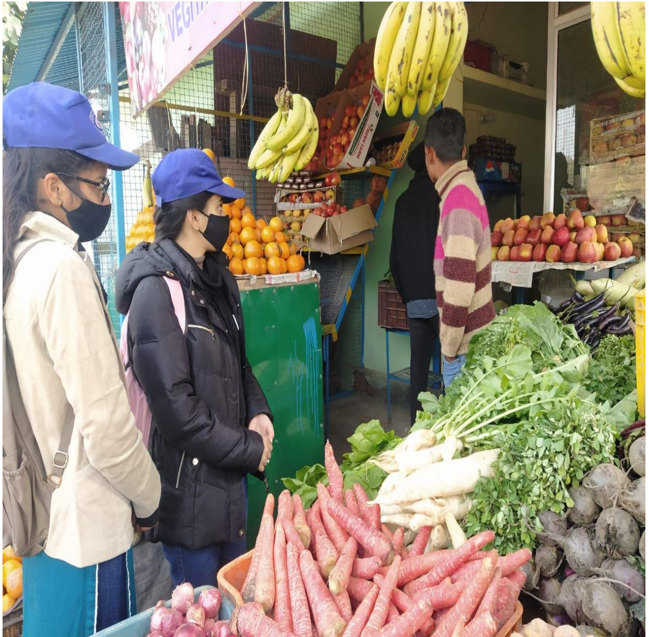
Photograph 22 Student making shopkeepers aware of Omicron: new variant of Covid