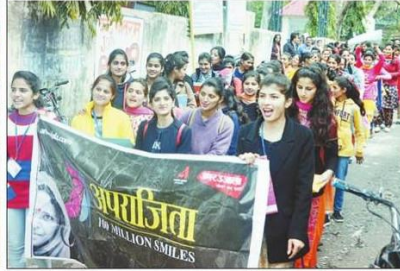
पांवटा साहिब में अपराजिता रैली में भाग लेती छात्राएं।