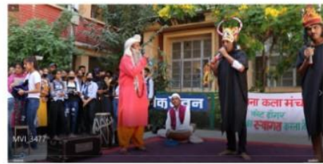
Photograph 20 Glimpses of Nukkad Natak on Drug Abuse on 12.10.2021