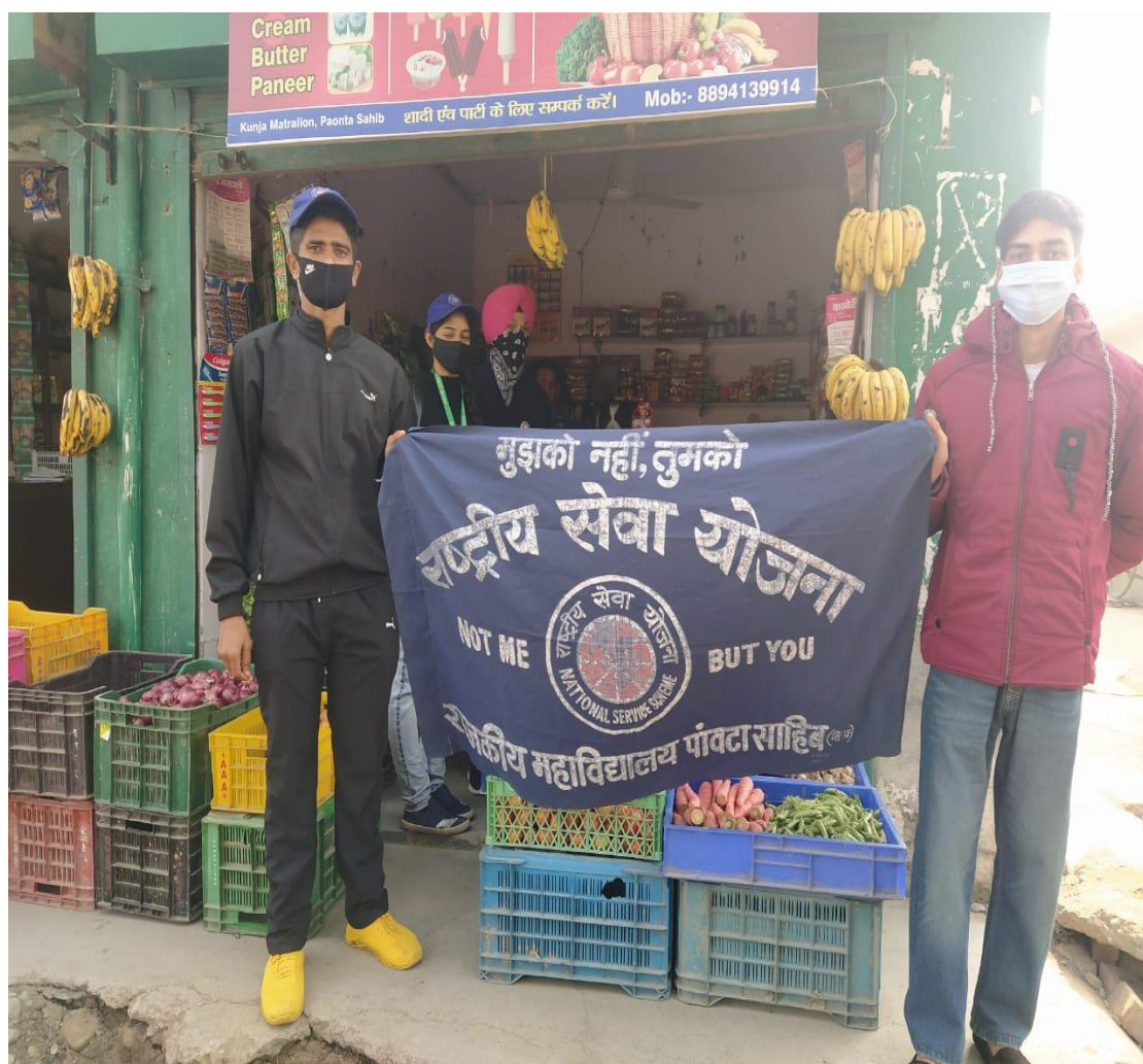
Photograph 21 Student making shopkeepers aware of Omicron: new variant of Covid