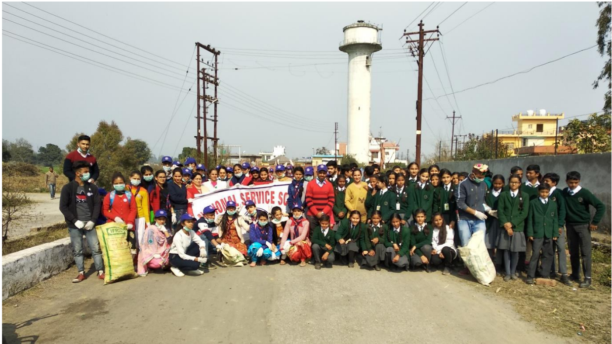
Photograph 30 Students of the college participating with schools in Clean City drive organised by administration on 06 th February 2020