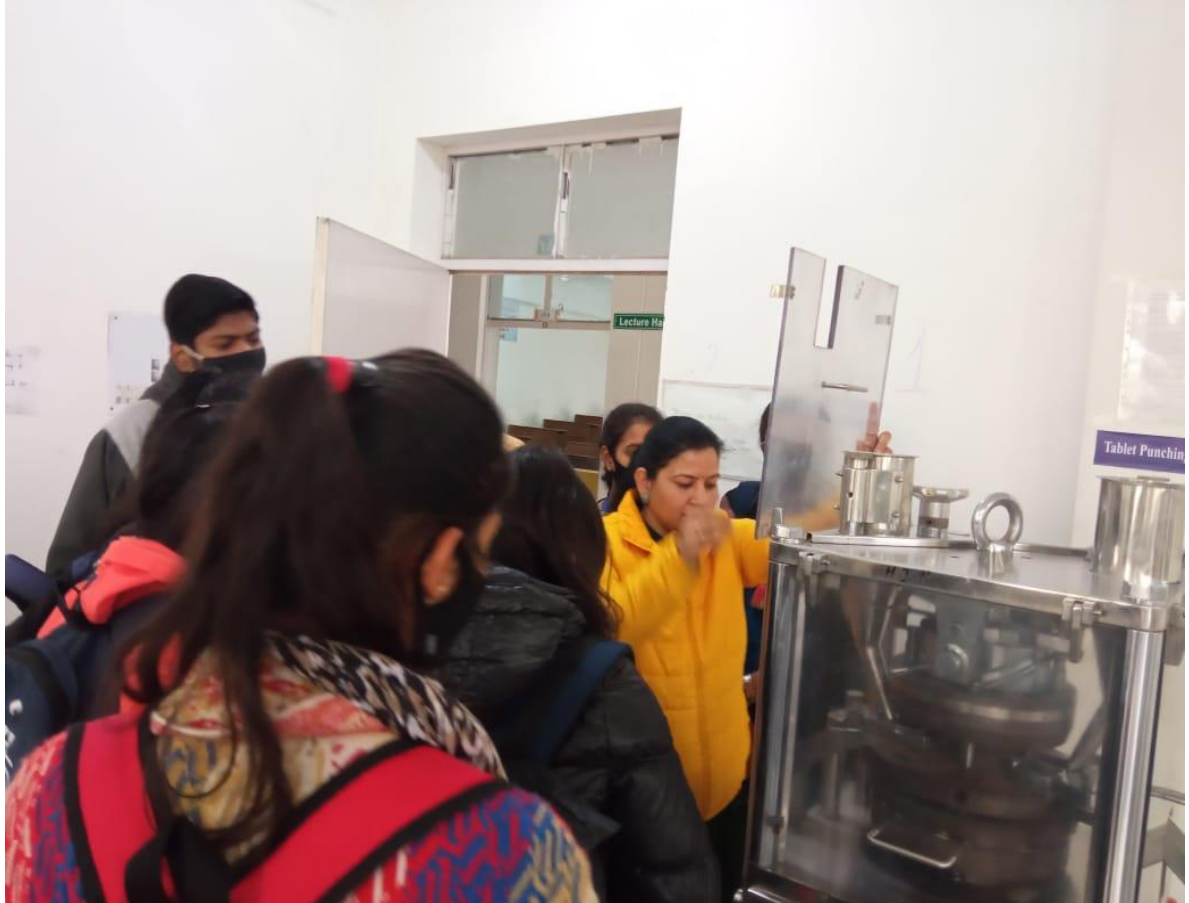
Photograph 8 Community College Students in Machine Room of Himachal Institute of Pharmacy