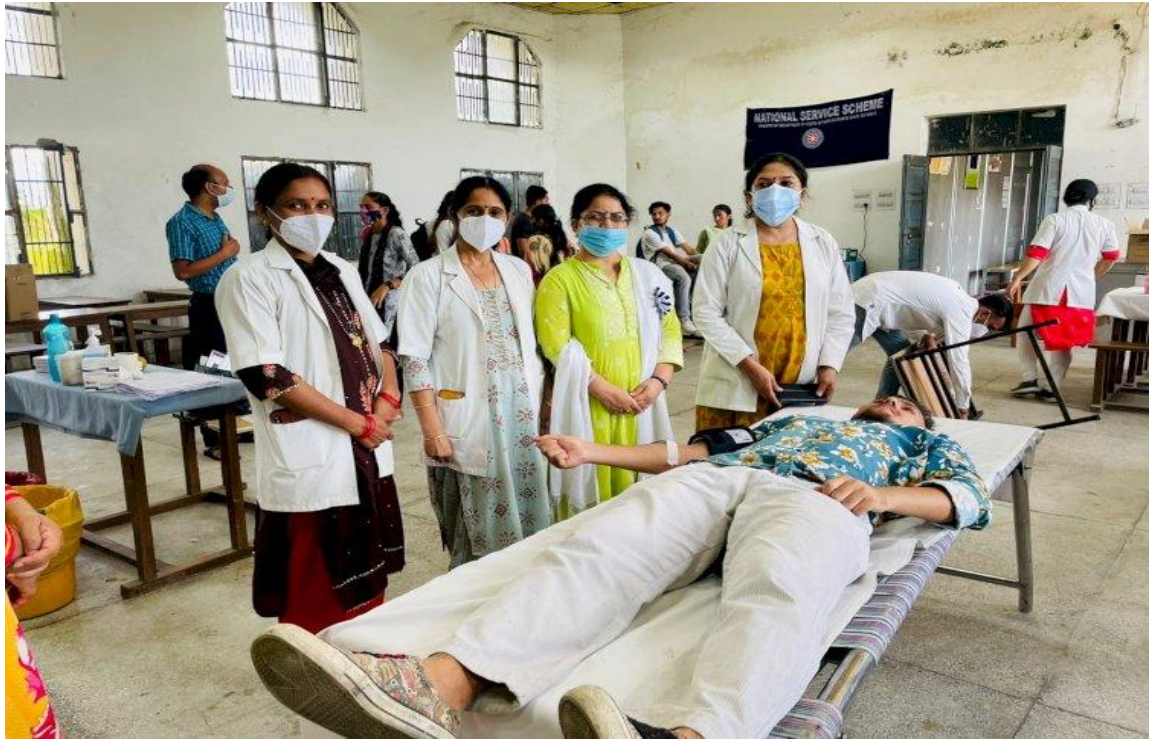
Photograph 10 Medical team with organising team