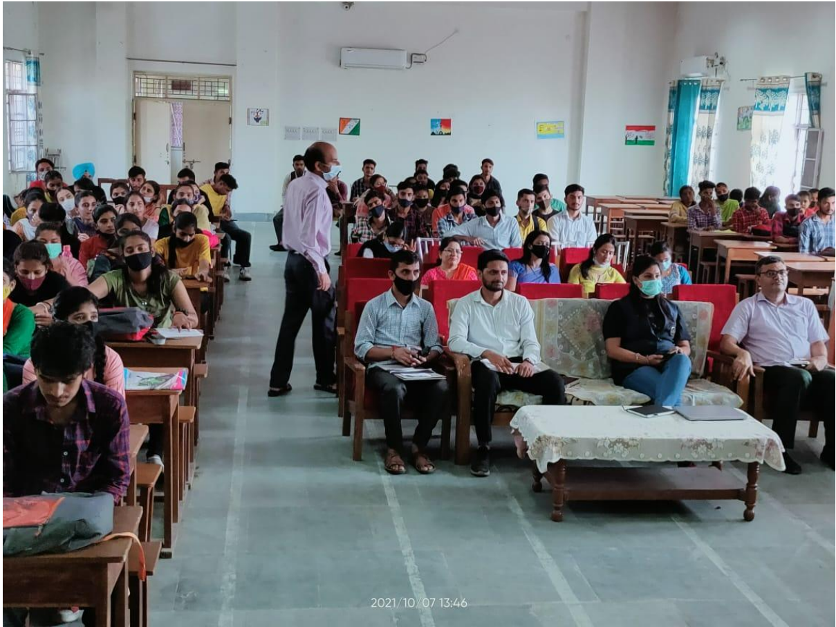
Photograph 25 Students attending workshop