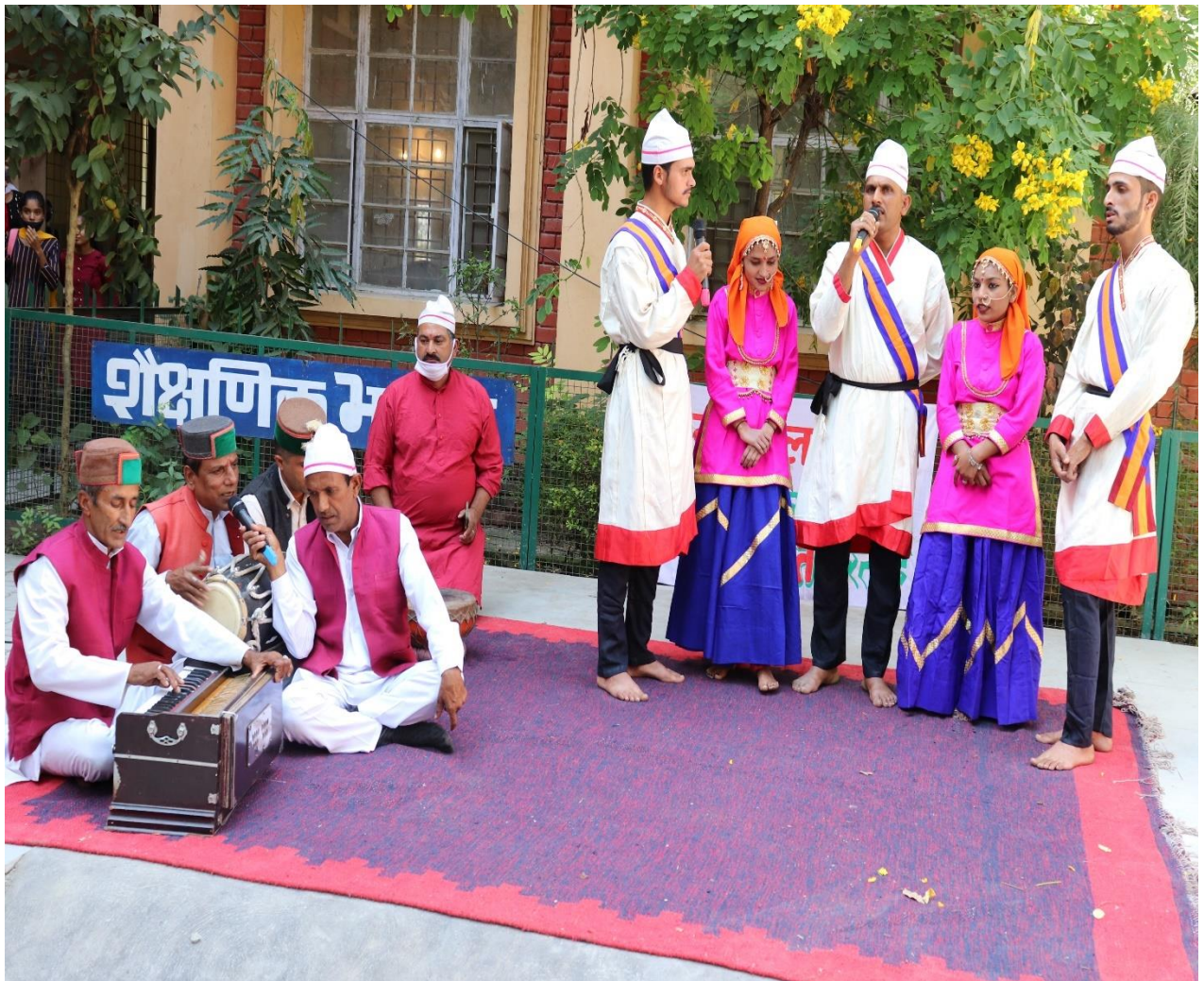
Photograph 19 Artist from Bhasha, Kala evm Sahitya Academy, Nahan