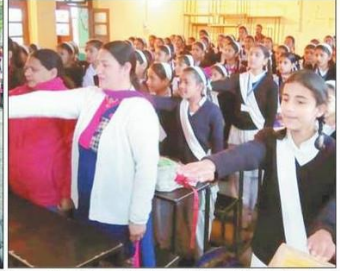
दवाह में अपराजिता कार्यक्रम में शपथ लेती छात्राएं और अध्यापिकाएं।