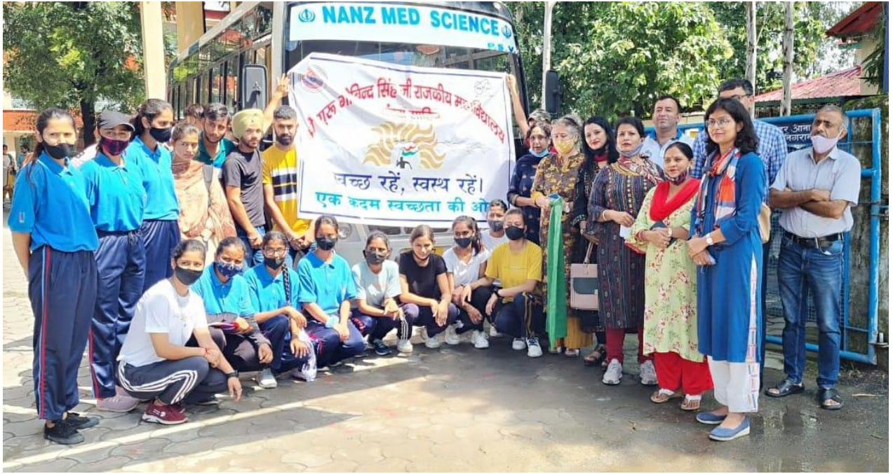
Photograph 16 NCC cadets, students and staff before Swachhta Abhiyan in Community