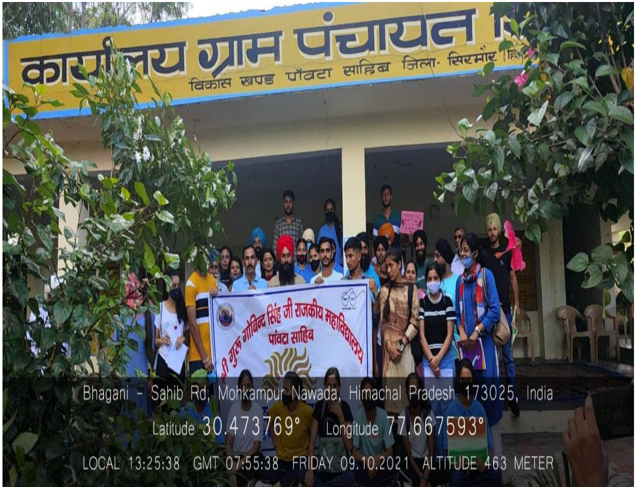
Photograph 18 Students and staff with villagers in Shivpur