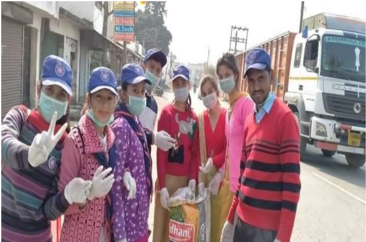
Photograph 29 Students at Bangran Chowk during Dleanliness drive in city