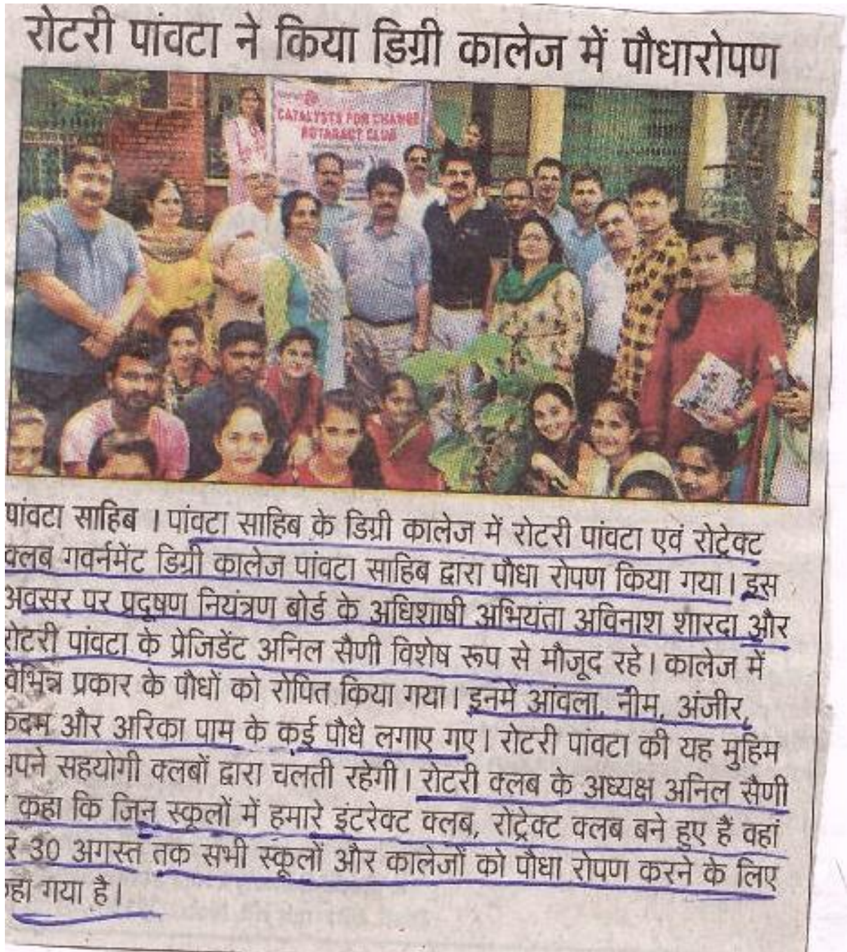
News Clip 8 Divya Himachal 23.08.2019 p. 4