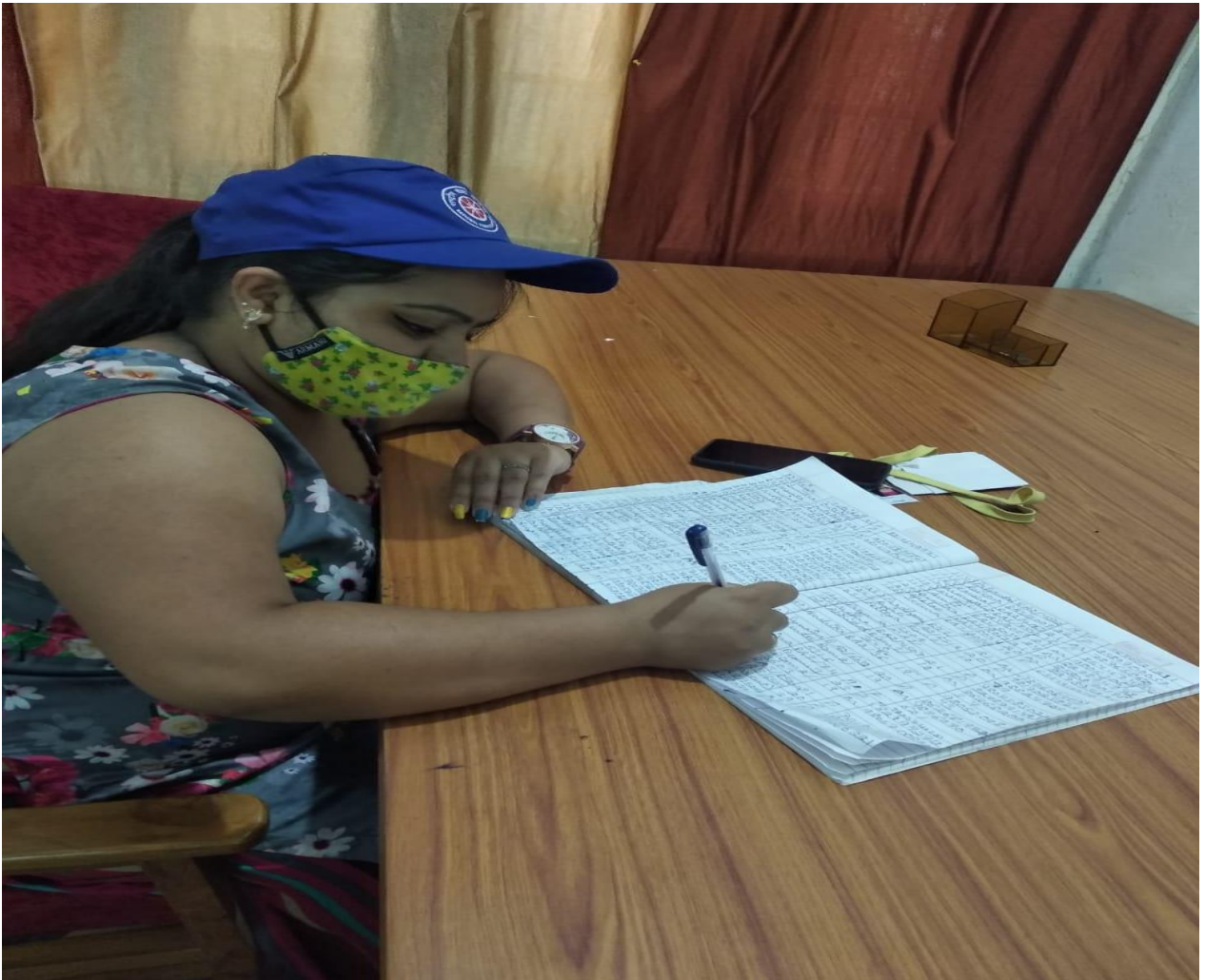
Photograph 13 Volunteer engaged for keeping record of vaccinated people