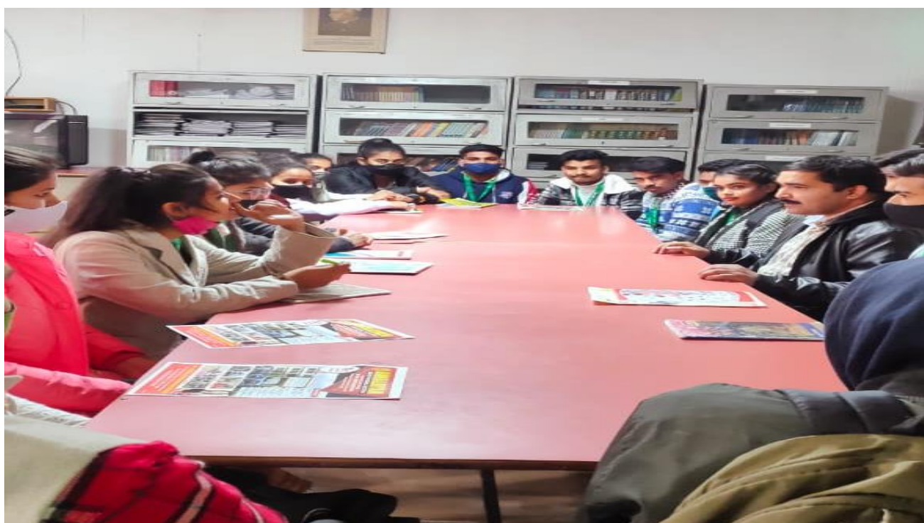
Photograph 2 Students of B.Com 3 rd Yr in Himalayan Institute of Management Library