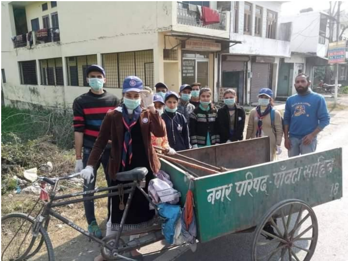
Photograph 27 Students with Municipal Corporation workers during cleanliness drive in the city