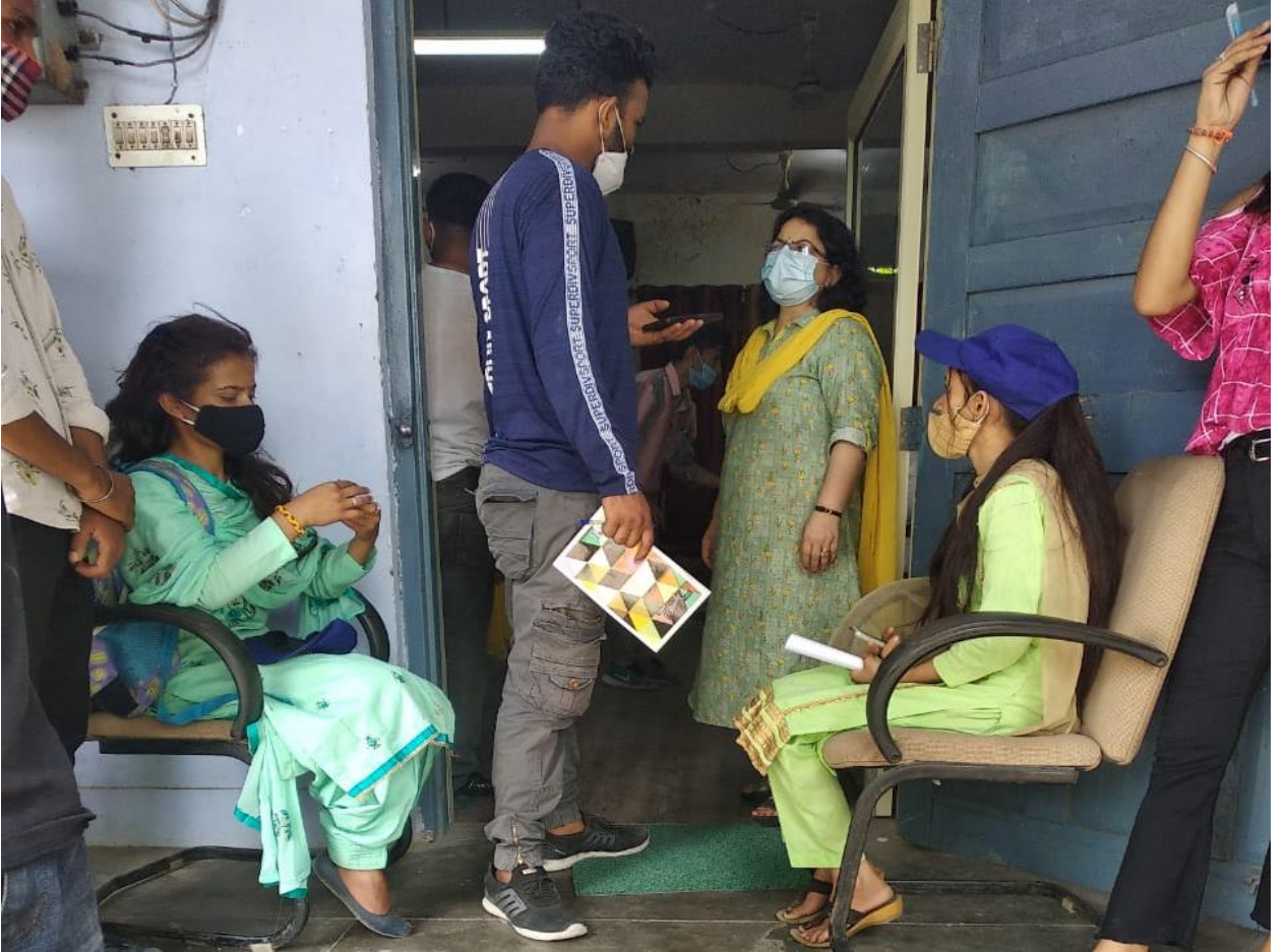
Photograph 12 Students engaged to observe social distancing at the entrance during vaccination drive