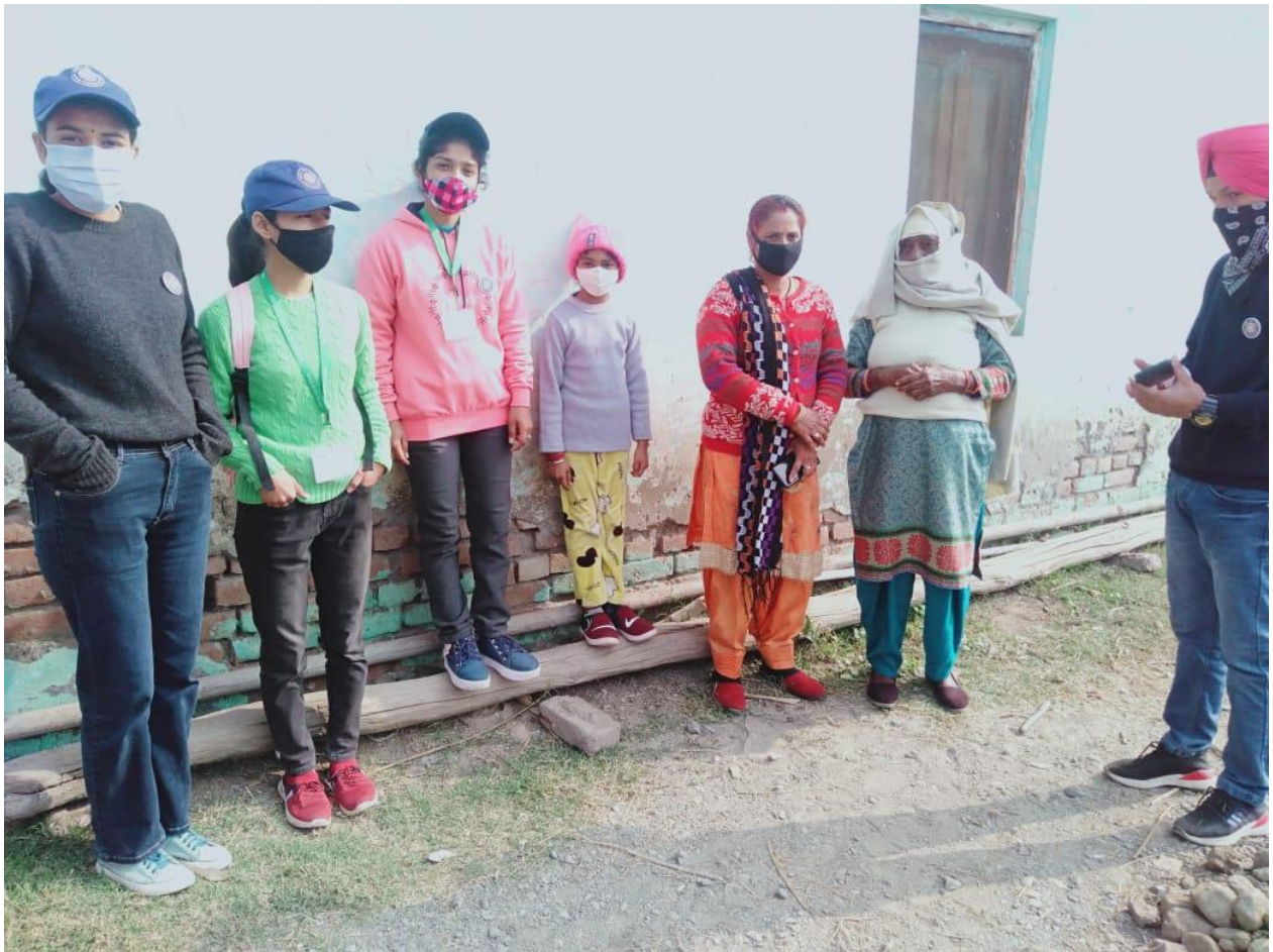
Photograph 24 Students with ladies in adopted village Kunja Matralion, for asking them to stay vigilant to observe the SOPs of Covid Pandemic