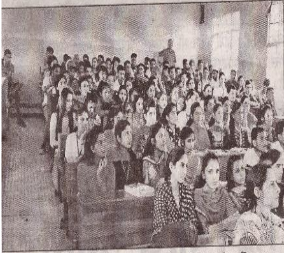
पांवटा साहिब - पीजी कालेज में जागरूकता कार्यक्रम में मौजूद विद्यार्थी व स्टाफ