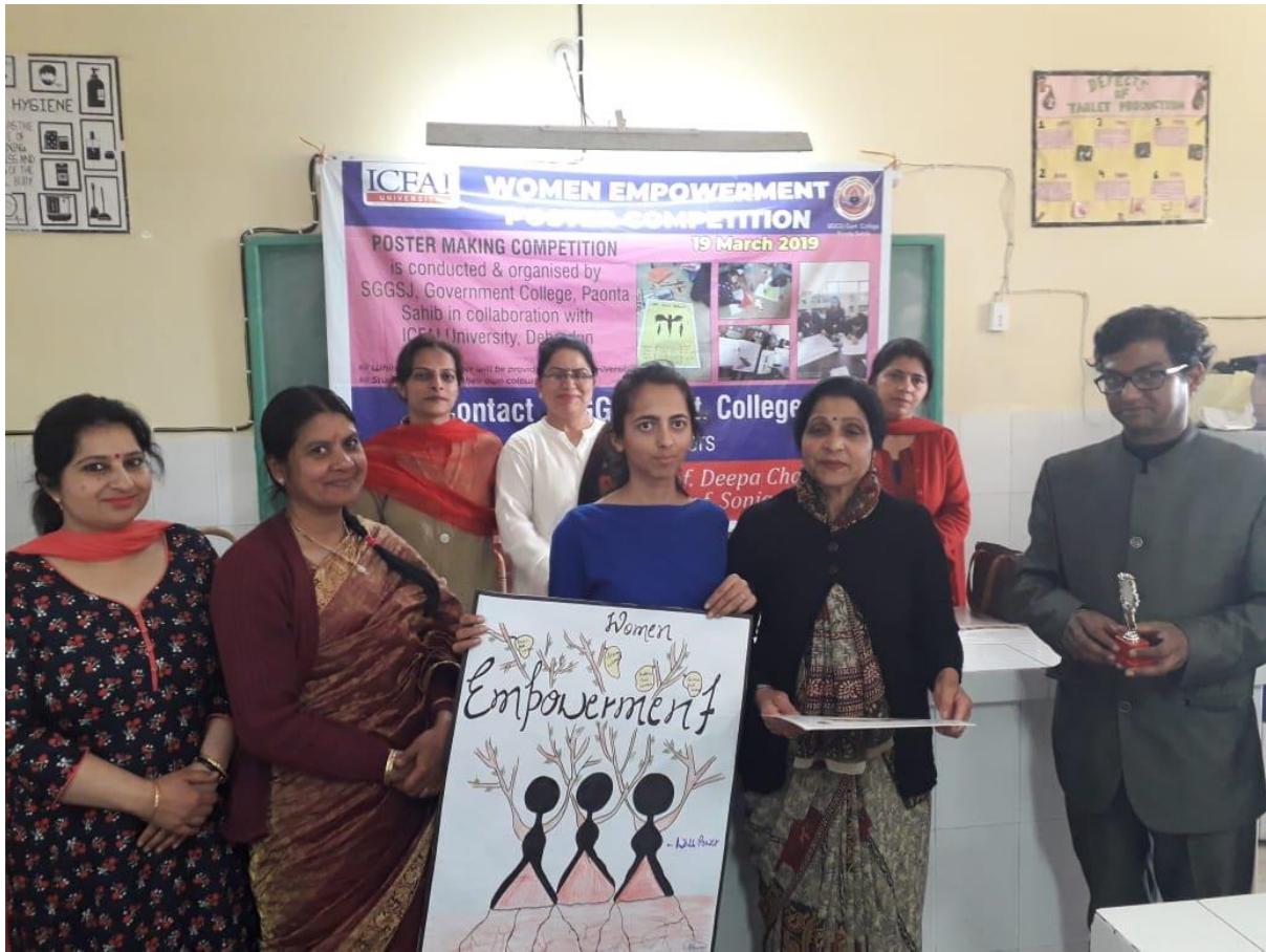
Photograph 38 Poster on Women Empowerment