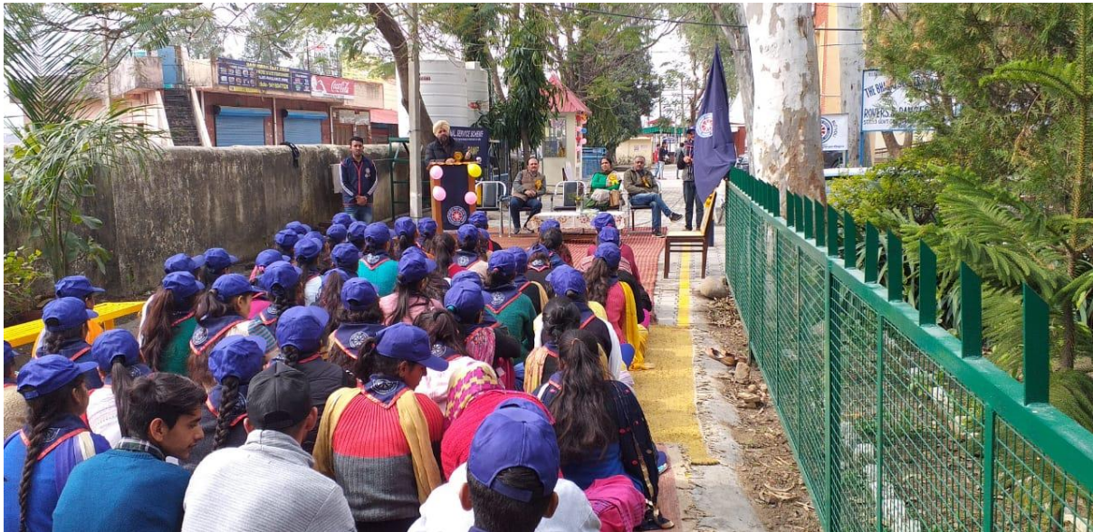
Photograph 39 Volunteers during technical session