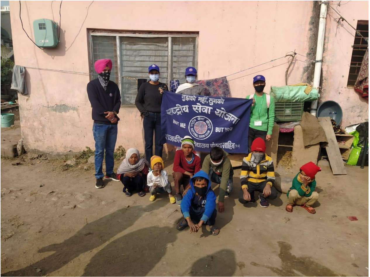
Photograph 23 Students with children in adopted village Kunja Matralion for spreading awareness about Covid 19, literacy and to continue their education during lockdown