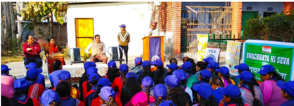
Photograph 40 Volunteers during technical session