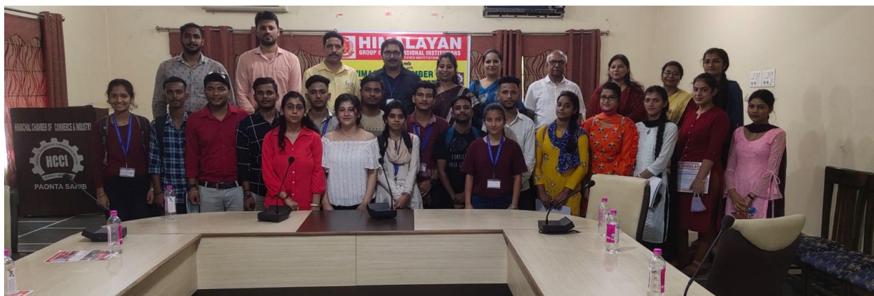
Photo 2: Students of SGGSJ Govt. College, Paonta Sahib, with organizer of Workshop.