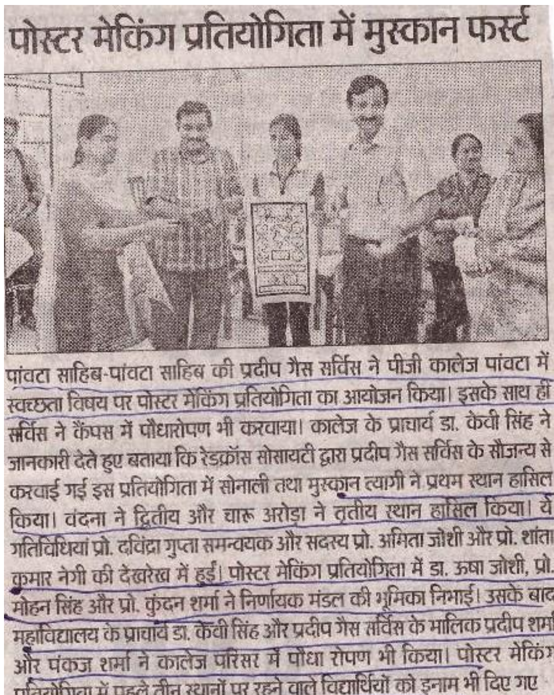
News Clip 17 Divya Himachal 02.08.2017, p.2