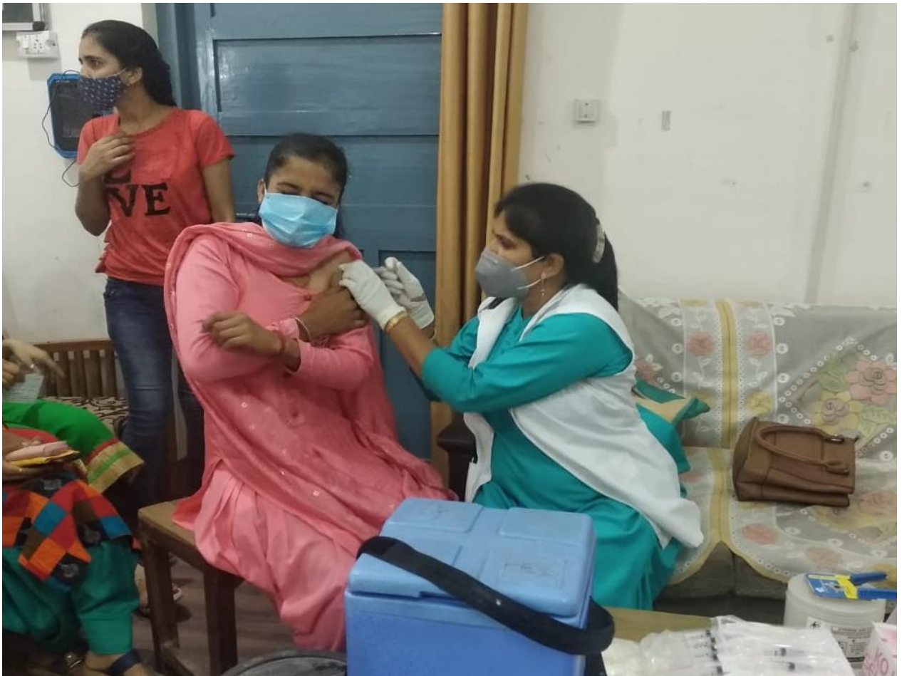
Photograph 14 Vaccination drive to combat against Covid 19