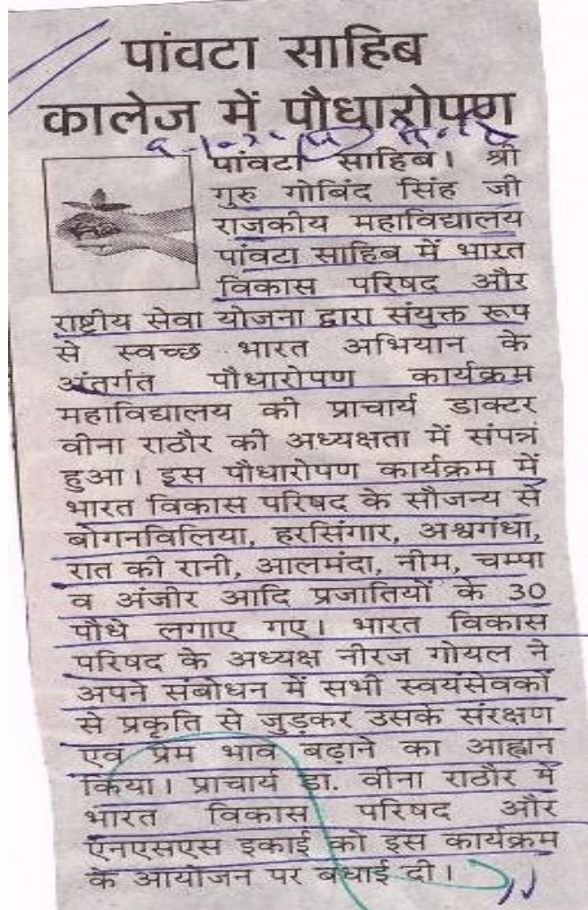
News Clip 3 Divya Himachal 09.10.2021 p-4