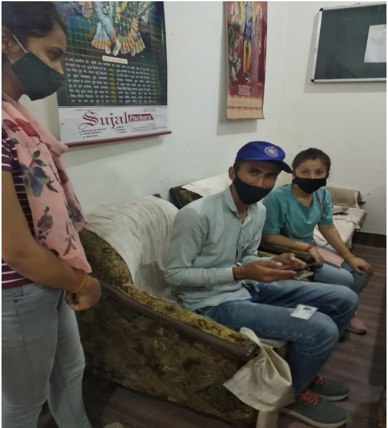
Photograph 15 Volunteers helping in registration of people for vaccination