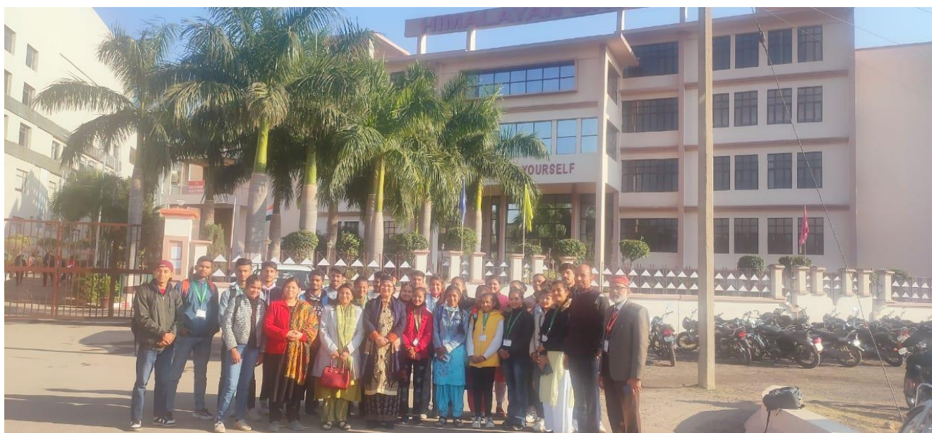
Photograph 1 Students and Faculty in Himalayan Institute Campus with their Staff